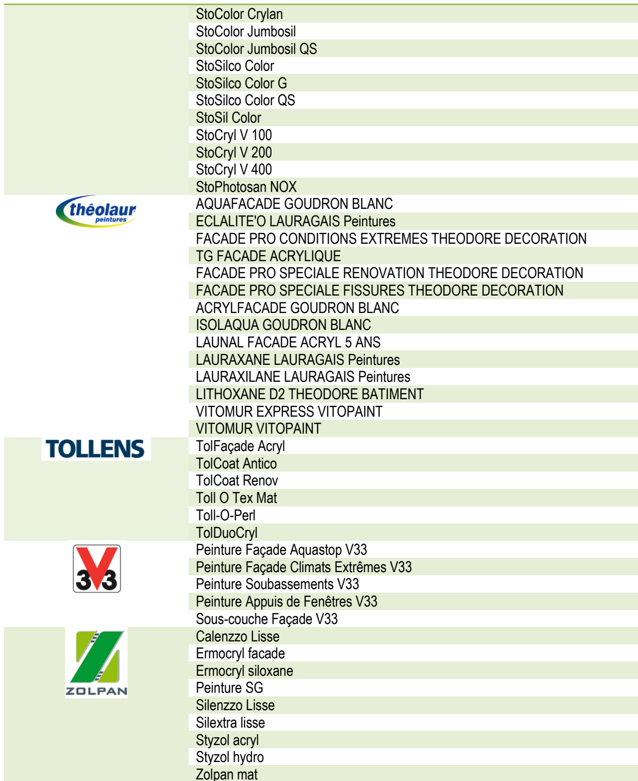
Tableau 1 : Entreprises et références associées couvertes par la présente FDES