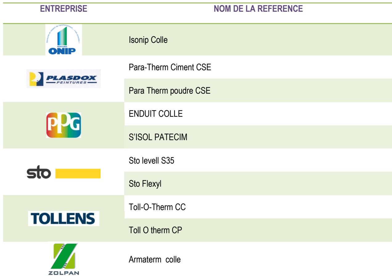
Tableau 1 : Entreprises et références associées couvertes par la présente FDES